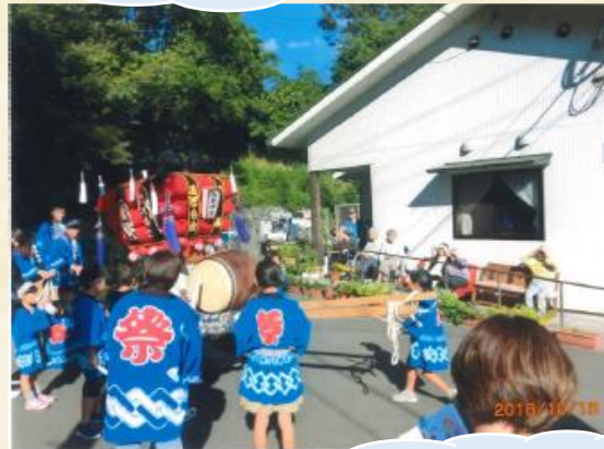
わっしょい！わっしょい！

ホームの夏祭り！ホールに1日限りのカキ氷、 ヨーヨー釣り、金魚(?)すくい屋も出ます。 季節のイベントも盛りだくさん♪♪ ご家族の方も一緒に♪職員もハッピー姿でがんばります！