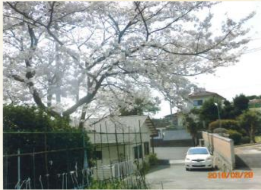
春には庭でお花見✿ おいしいお弁当も！！

定員9名の小さなグループホームです。 ひとりひとりの『笑顔』を大切に居心地の良い 環境を提供しています。 近くの医療機関、訪問看護ステーション等との 連携体制を整えています。