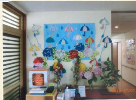
AEDも設置しています