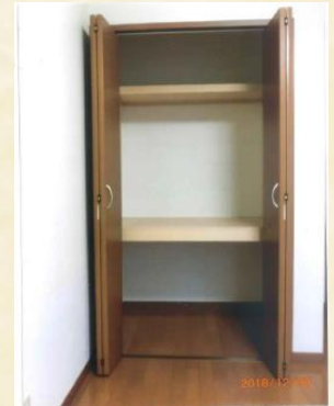
居室内クローゼット